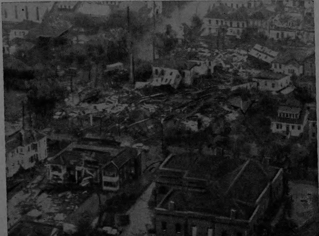
DESPUES DE LA TORMENTA UN TORNA-DO. — Luego que el huracán "Carla" azotó las costas del Golfo de México, un tornado le siguió causando desolación y muertes en el poblado de Galveston, Texas. El grabado muestra una vista del sector comercial de dicho poblado, el cual se halla bajo agua. Brigadas

"The monkey trial" como fue llamado aquel "proceso del mono", sentó un principio de alcance universal. El objetivo supremo es Dios; la ciencia con sus avances cotidianos nos enseña uno de los caminos para llegar a El.