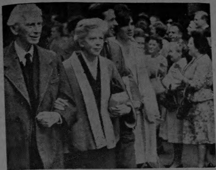
RESPALDAN A RUSSELL. —Un grupo de simpatizadores del filósofo inglés Karl (Bertrand) Russell vitorean al anciano y a su esposa cuando estos abandonan el tribunal donde fueron sentenciados a siete días de cárcel por haber incitado una protesta sentada pidiendo la abolición de las armas nucleares. Russell rehusó comprometerse a "observar una buena conducta" y a prestar fianza. Los simpatizadores del anciano filósofo de 89 años, se proponen hacer otra demostración de protesta frente al Parlamento.