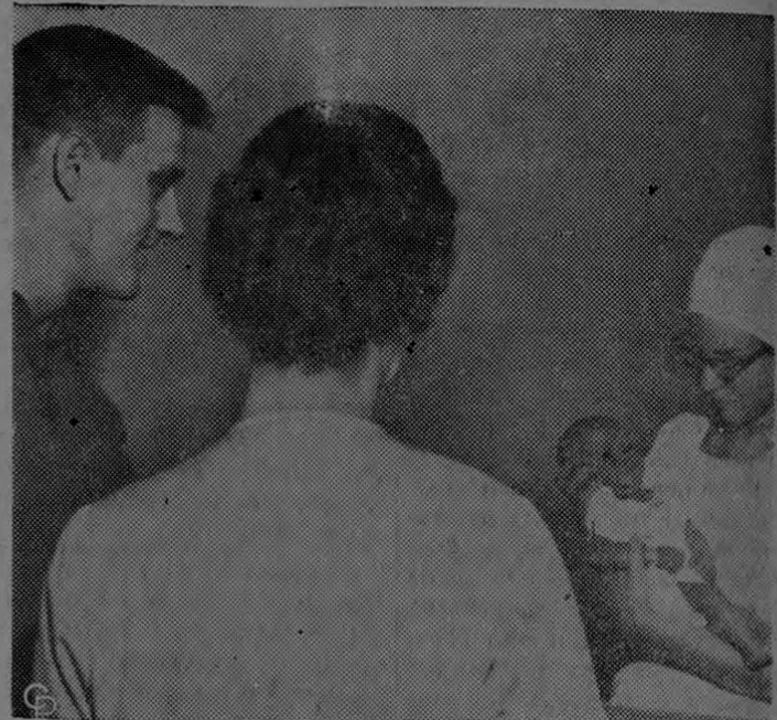
PADRE ORGULLOSO. — Róger Maris, el famoso pelotero de los Yanquis de Nueva York, aparece junto a su esposa (de espaldas a la cámara) mientras él da una mirada a su hijo recién nacido en un hospital de Kansas City. El niño nació cuando su famoso padre bateó su 50 cuadrangular en Los Angeles. Es posible que el niño sea bautizado con el nombre de Homer.